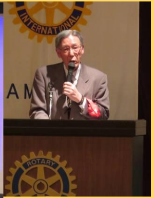
基本講演 経済学者 坂本光司様