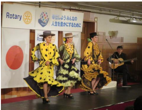
フラメンコ・ダンス&歌・ギター演奏