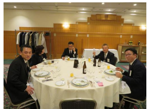
豪華な料理とワイン