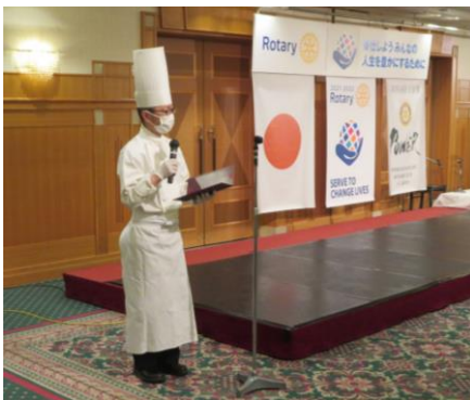
オークラホテル料理長より本日の食事メニューの紹介