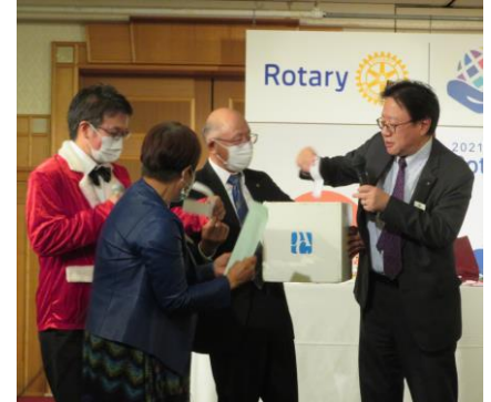
豪華景品大抽選会開始